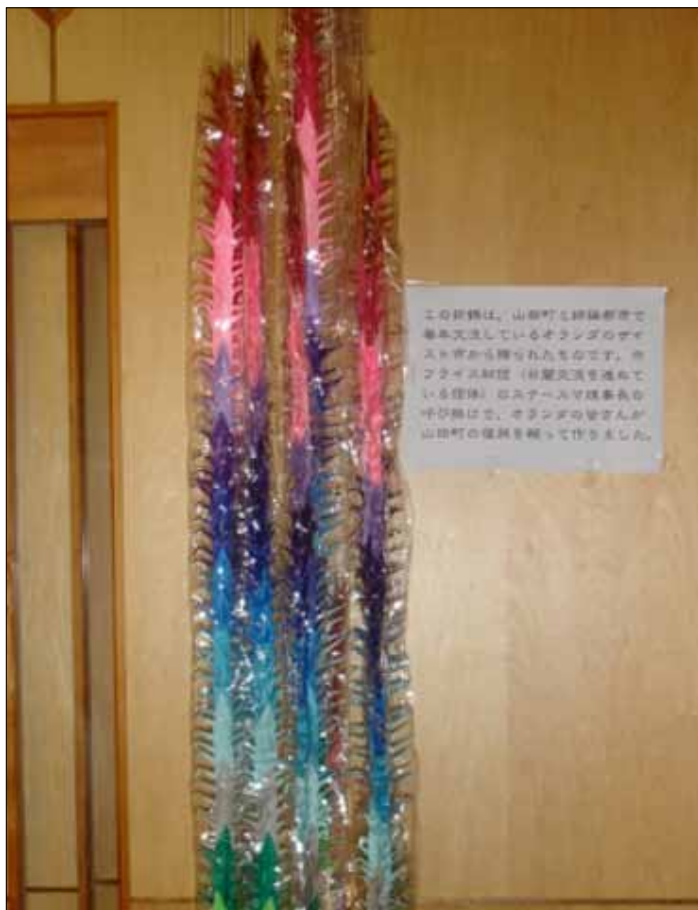
De kraanvogels die 'De Hofreis' aan de Yamada JHS zond namens de Japanse Ambassade en het SieboldHuis.

De middag was een enorm succes en stond ik het teken van 'Zeist helpt Yamada'. Het bestuur van Stichting 'De Hofreis' kan met trots melden dat de opbrengst voor Yamada € 1.813,81 bedraagt! Dat is natuurlijk geweldig en wij willen iedereen die hier aan heeft bijgedragen, van harte bedanken! Vooral ook veel dank aan het Slottuintheater die deze dag mede voor ons gefaciliteerd heeft!